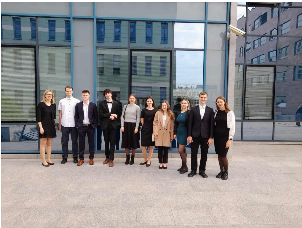
Před Justičním palácem v Brně