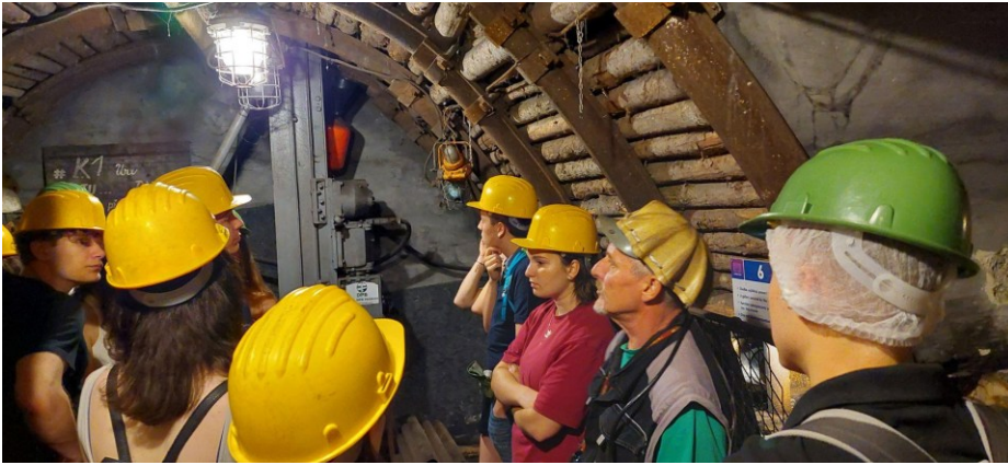
Expozice hlubinného dobývání, důl Anselm