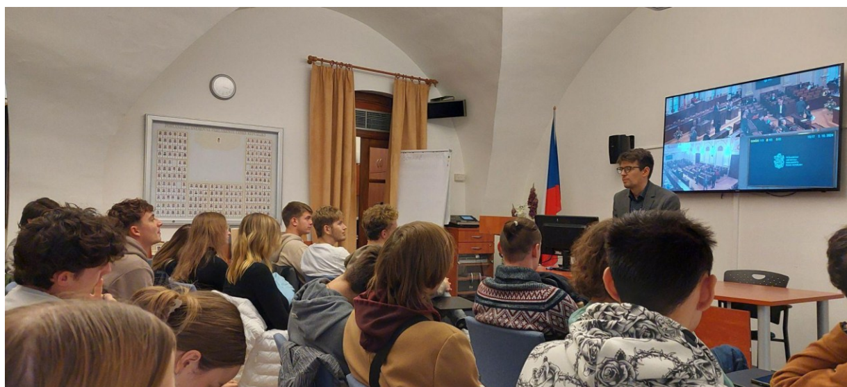
V poslanecké sněmovně