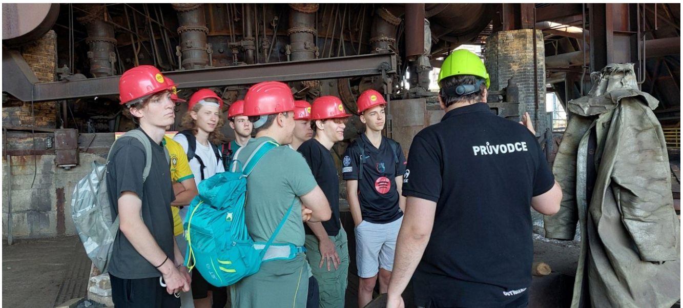
Areál Dolních Vítkovic, vysokopecní okruh