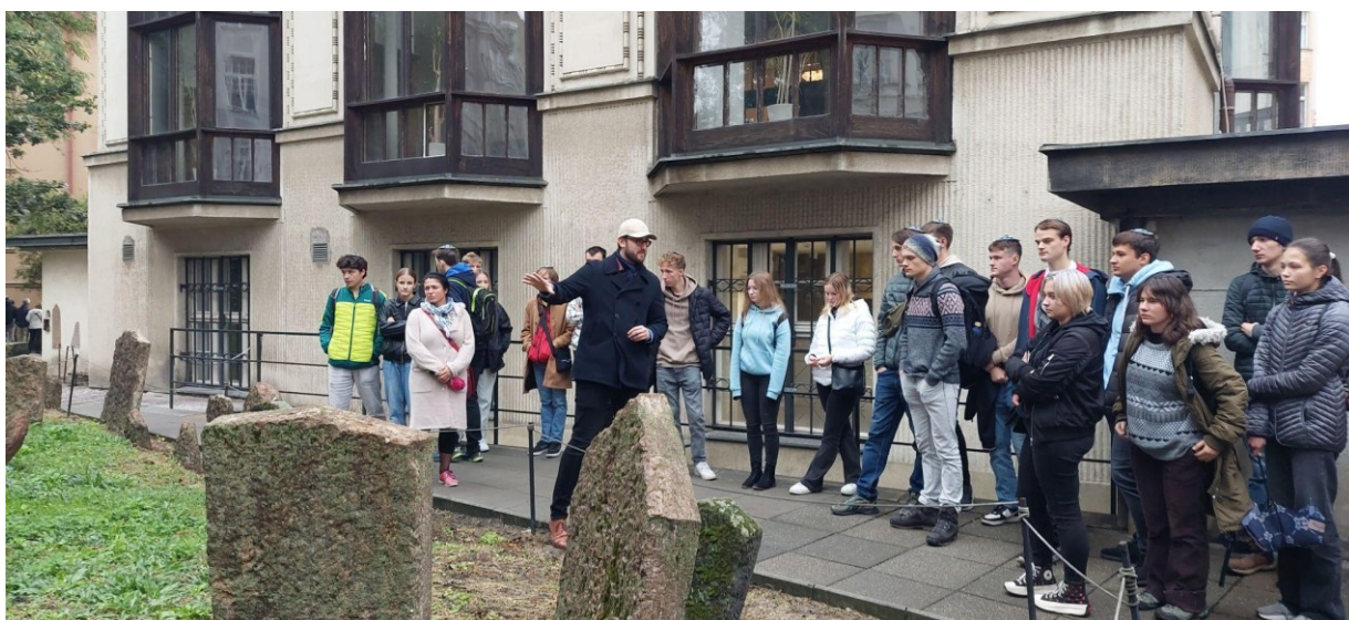
Návštěva starého židovského hřbitova v Praze

První letošní několikadenní třídní výlet patřil oktávě, která se vydala objevovat krásy Prahy. Pobyt finančně podpořilo SPGŽ. Studenti si sami připravili komentáře k jednotlivým památkám, které navštívili nebo „jen minuli“ cestou a zahráli si tak na průvodce. Třídenní program zahrnoval návštěvu Poslanecké sněmovny České republiky, návštěvu několika muzeí včetně výukového projektu zaměřeného na holocaust, večerní divadelní představení a samozřejmě společné procházky po vyhlášených památkách a místech v Praze.