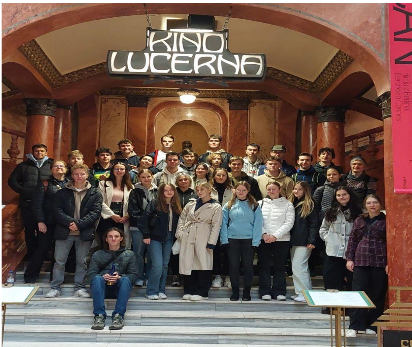
Procházka nejnámější pražskou pasáží