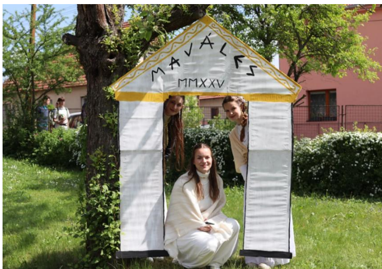
Žáci kvinty a třetího ročníku.

Majáles je každoroční tradice oslav studentského života konající se k příležitosti vítání máje. I na naší škole se již tradičně naši žáci těmto oslavám věnují. Volí si svého krále a královnu Majálesu, připravují pro své spolužáky různé soutěže, aktivity a legrácky, které během majálesového dopoledne žáci absolvují. V letošním roce byl Majáles pojat v antickém duchu, takže králem byl císař a královnou císařovna. Dopolední aktivity pak byly zakončeny vyhodnocením nejlepších masek a průvodem obcí Zastávka.