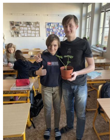
Zpracovala Mgr. Darina Honsová a Mgr. Šarlota Klein