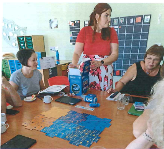
DIGI akce - robotické pomůcky