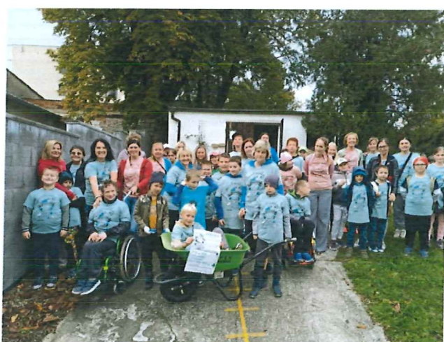
Akce 72 hodin