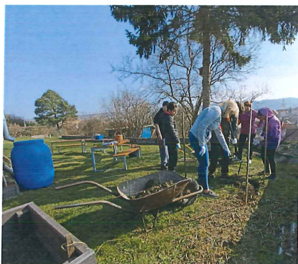
Každý metr se počítá