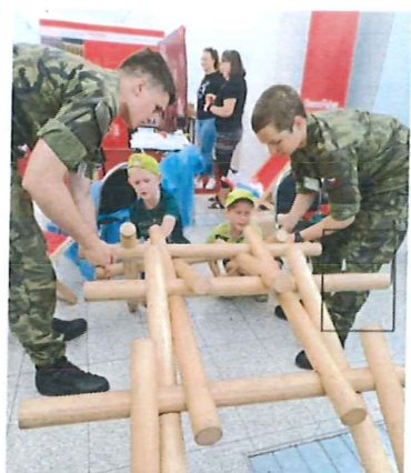
Festival vědy a techniky