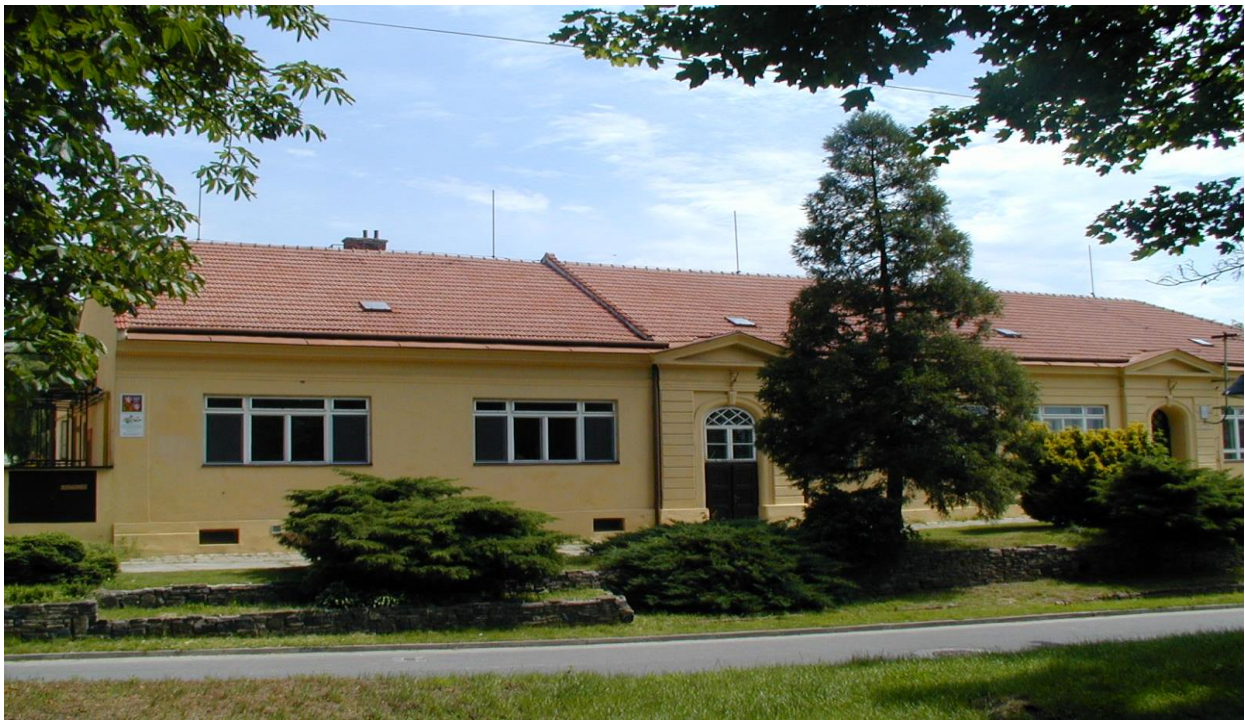
odloučené pracoviště – ulice J. Hanáka 53 (stará škola)