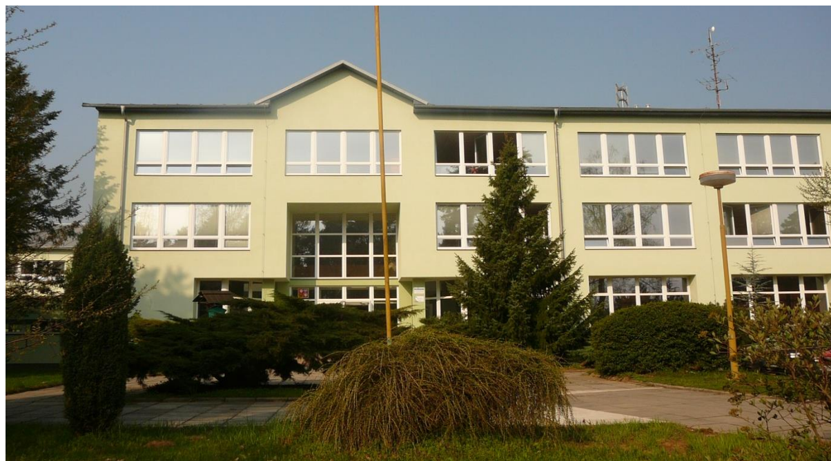
odlučené pracoviště Bzenec – Přívoz 735