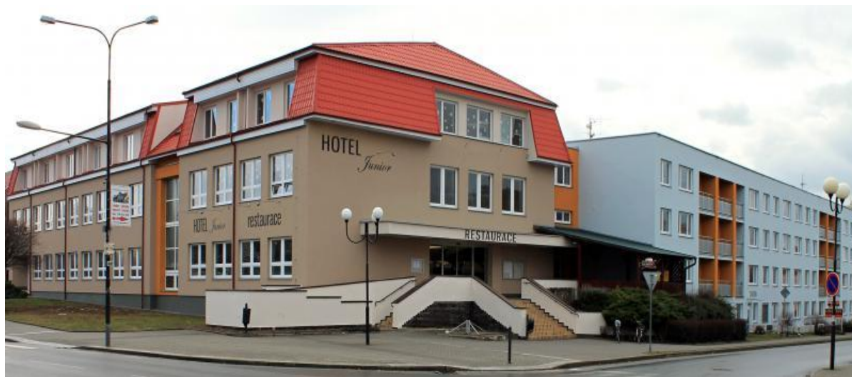
náměstí Svobody 318 – ředitelství