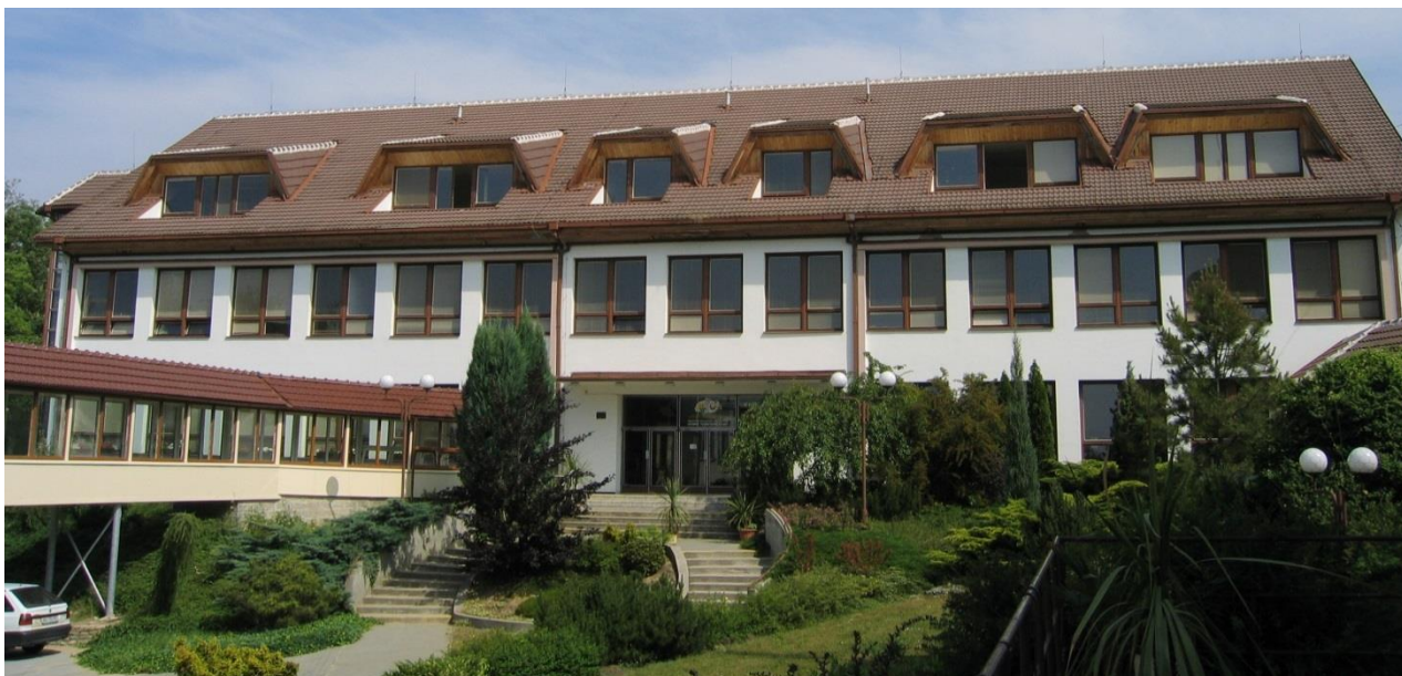
odloučené pracoviště – Vinařů 354 – DM