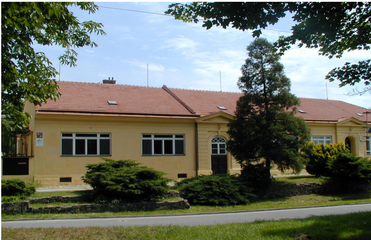
odloučené pracoviště – ulice J. Hanáka 53 (stará škola)