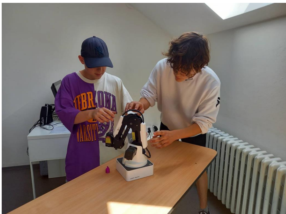
Robotická ruka zakoupená v rámci projektu iKAP II.