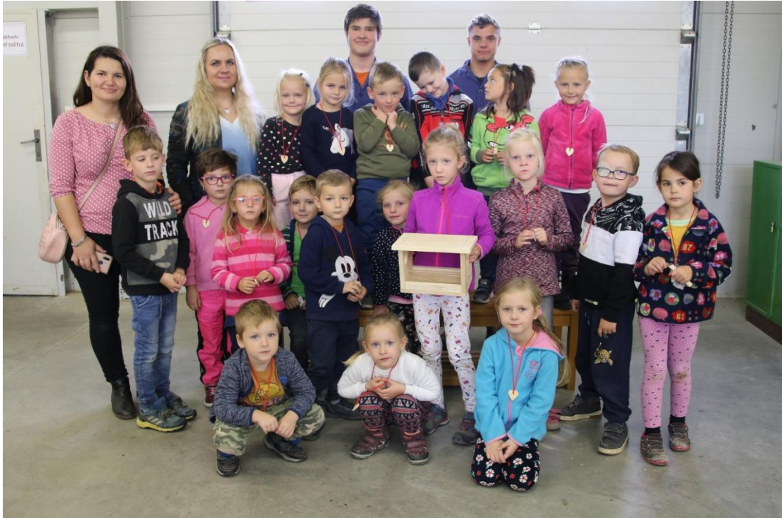
Exkurze MŠ v dílnách OV v Polánce