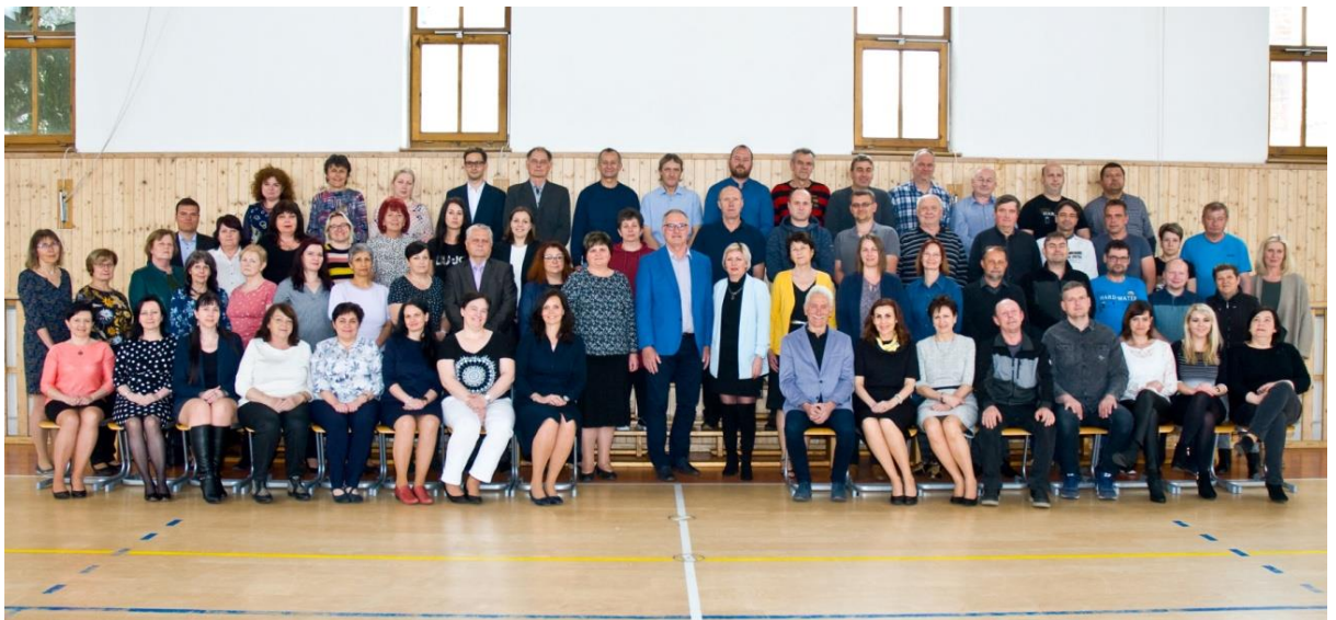
Zaměstnanci SŠDOS MK, p.o. ve školním roce 2021/2022