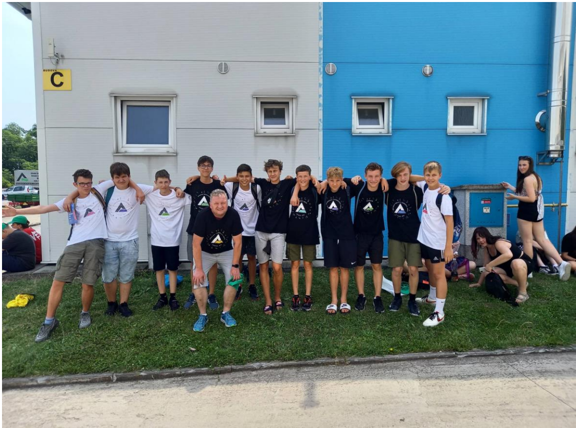
Kroužky a polytechnické dny pro žáky ZŠ v rámci projektu IKAP II.