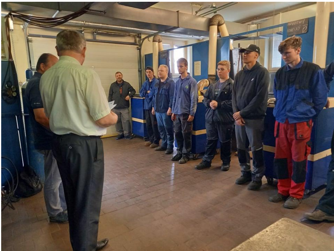
Kurz svařování- závěrečné zkoušky