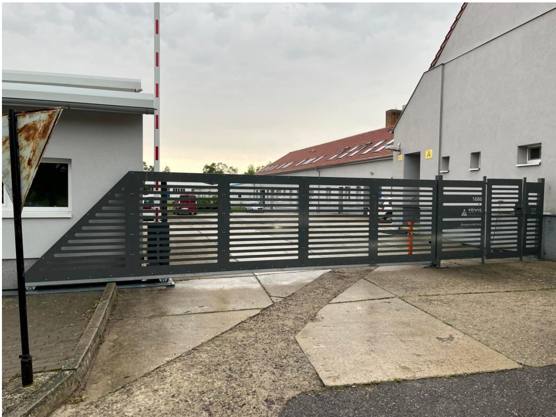
Nová brána v dílnách OV Polánka