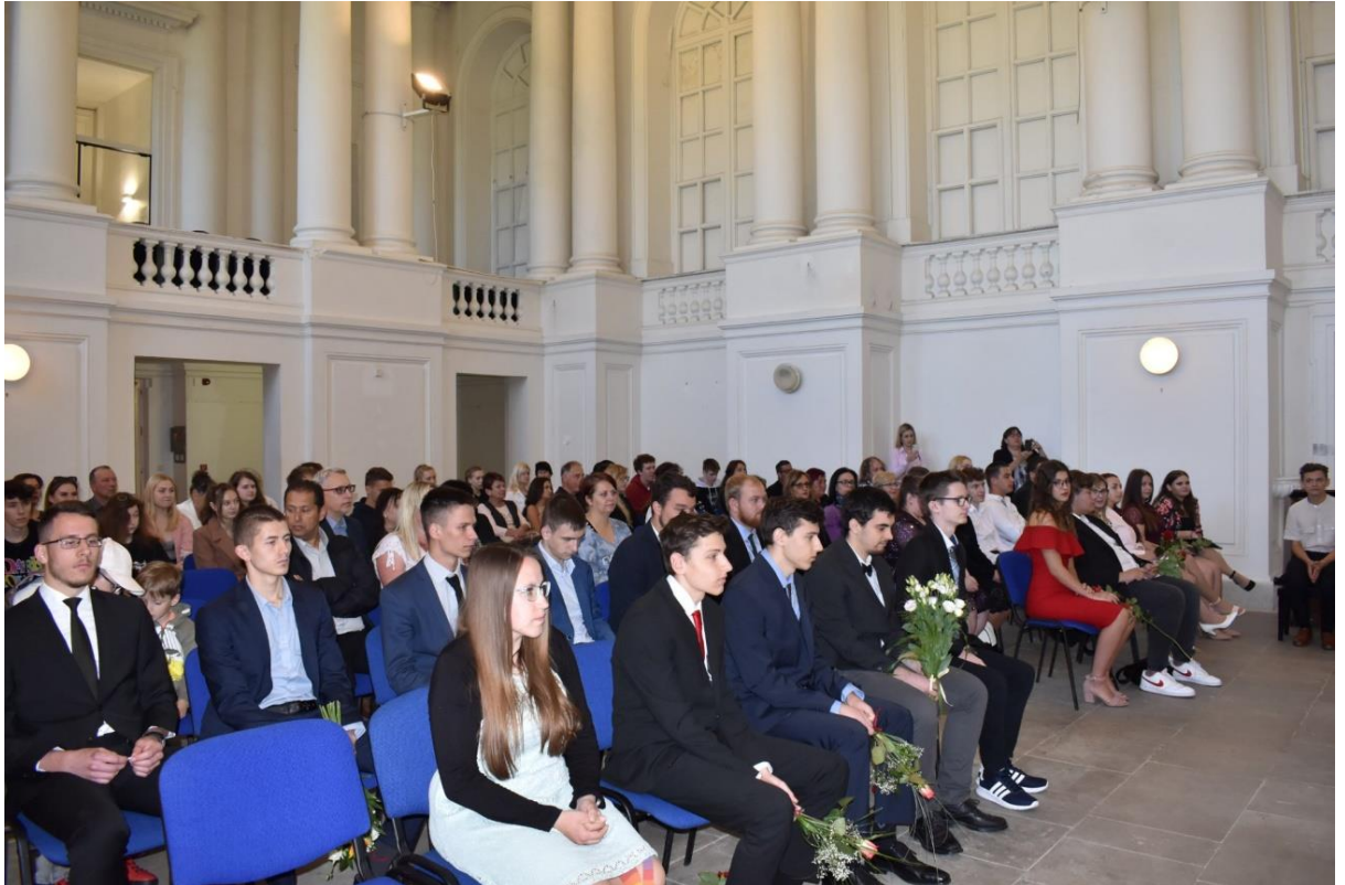
Slavnostní vyřazování absolventů SŠDOS MK, p.o. na krumlovském zámku