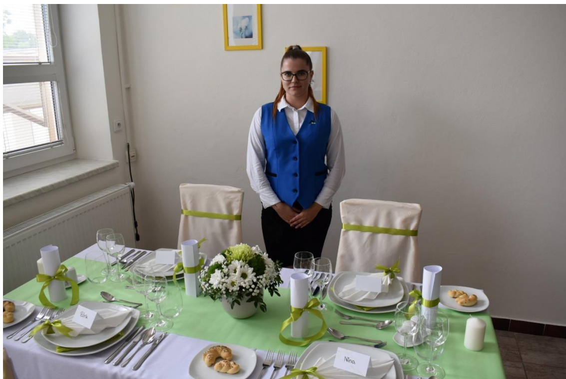
Závěrečné praktické zkoušky oboru Kuchař –číšník