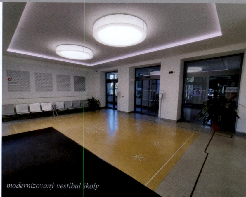
modernizovaný vestibul školy