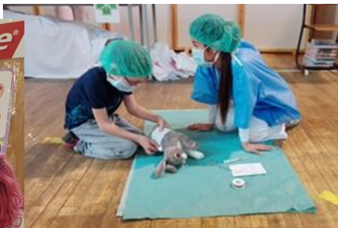
Nemocnice zvířátek ;o)