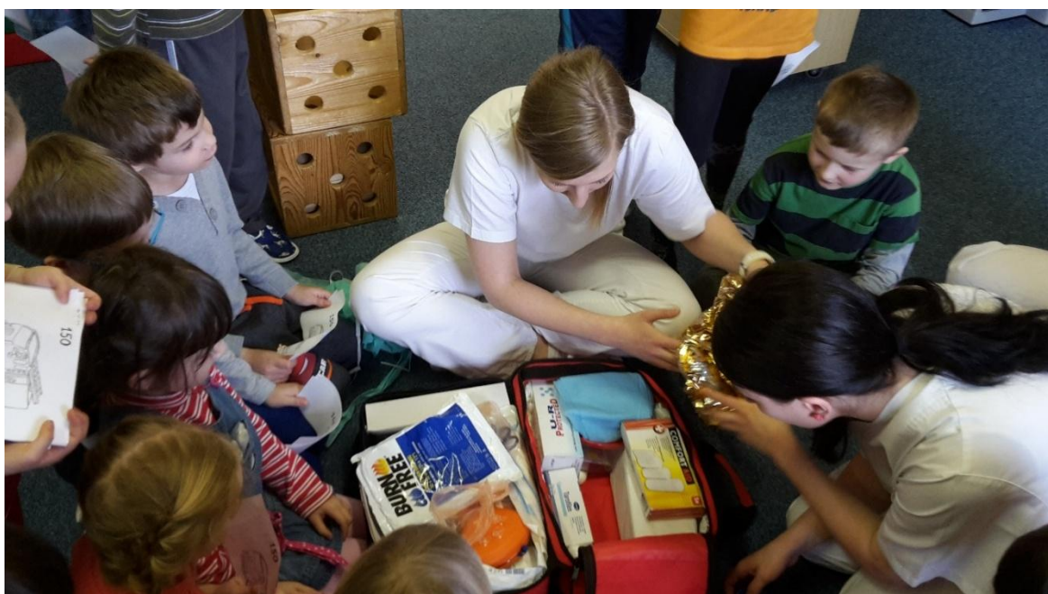
První pomoc v MŠ