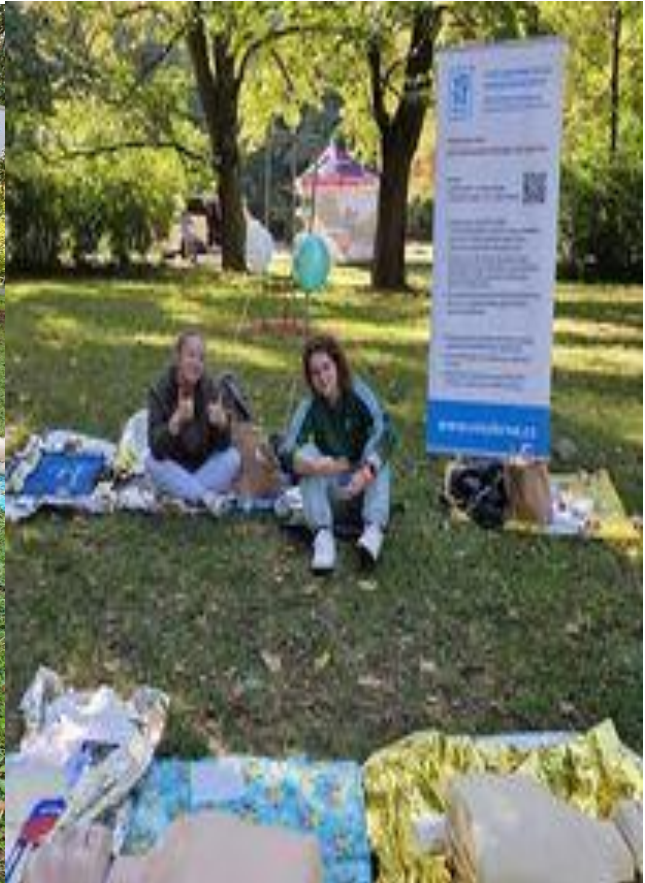
Evropský den mobility